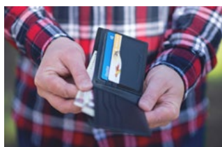
1 Varia loon- en premieheffing

Tevens bevat deze editie informatie over bijvoorbeeld de auto van de zaak, de thuiswerkvergoeding, de WKR en de transitievergoeding.